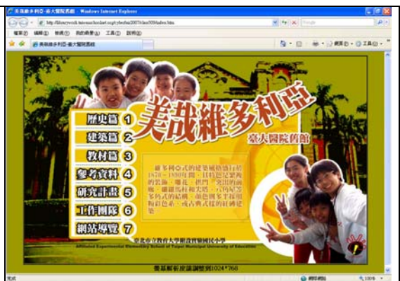
美哉維多利亞-臺大醫院舊館 網界博覽會 作品