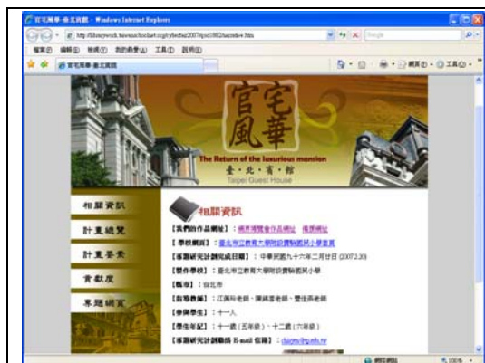
官宅風華-臺北賓館網界博覽會作品